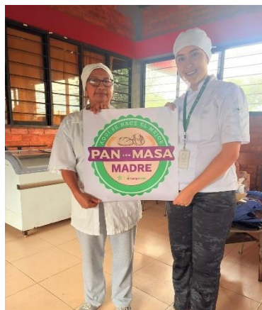
Foto 3. Foto final con el sello.