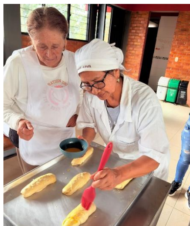
Foto 2. Elaboración de pan.